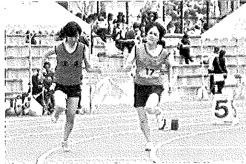
伴走者とゴールを目指す選手

陸上競技では、近年にない好天に恵まれ、大会新記録が45、大会記録5、大会タイ記録が4と全国大会にも通じる好記録が続出しました。他の会場でも日頃の練習成果が十分に発揮され、真剣勝負の中にも競技を楽しみ様子が見てとれ、大変良かったと思っております。