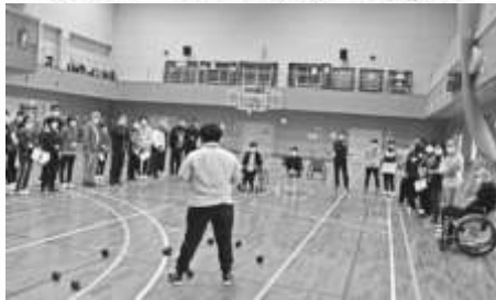
全国障害者スポーツ大会正式競技になったポッチャの実技

令和2年度県障がい者スポーツ指導員養成講習会が、10月24日、25日、11月21日、22日の4日間、ハートピアかごしまであり、21名が受講しました。この講習会は、日本障がい者