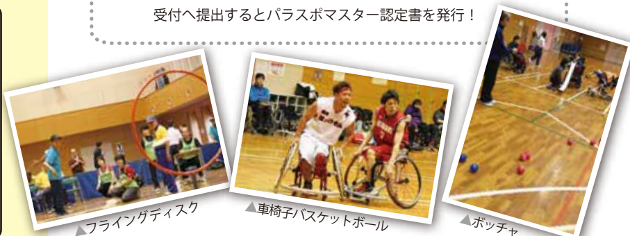
▲フライングディスク