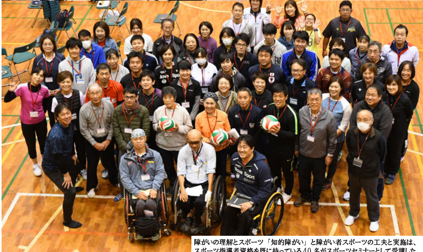
障がいの理解とスポーツ「知的障がい」と障がい者スポーツの工夫と実施は、スポーツ指導者資格を既に持っている40名がスポーツセミナーとして受講した。