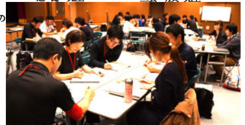
「安全管理」、「ボランティア論」ではグループ討議を実施