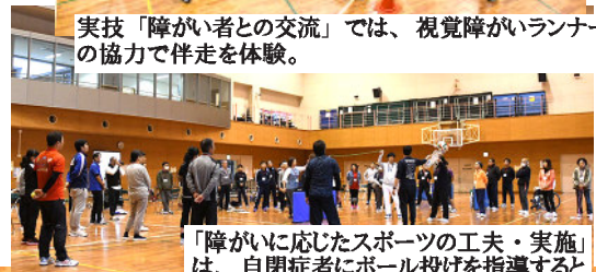
「障がいに応じたスポーツの工夫・実施」は、自閉症者にボール投げを指導するという課題をグループで取り組んだ。