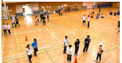
実技「障がい者との交流」では、視覚障がいランナーの協力で伴走を体験。