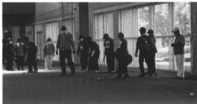
(決勝戦) 想定外チーム対与論チーム

第40回鹿児島県身体障害者ゲートボール大会は、5月9日に鹿児島ふれあいスポーツランド屋内運動場で実施。9チームがエントリーし、久しぶりの予選リーグ、決勝トーナメント方式で10月に福岡市で開催される九州大会の出場権を競いました。 県大会のエントリー数が年々減っていくなか、離島勢が5チーム参加。実力派ぞろいの戦いは白熱し、大変盛り上がりま